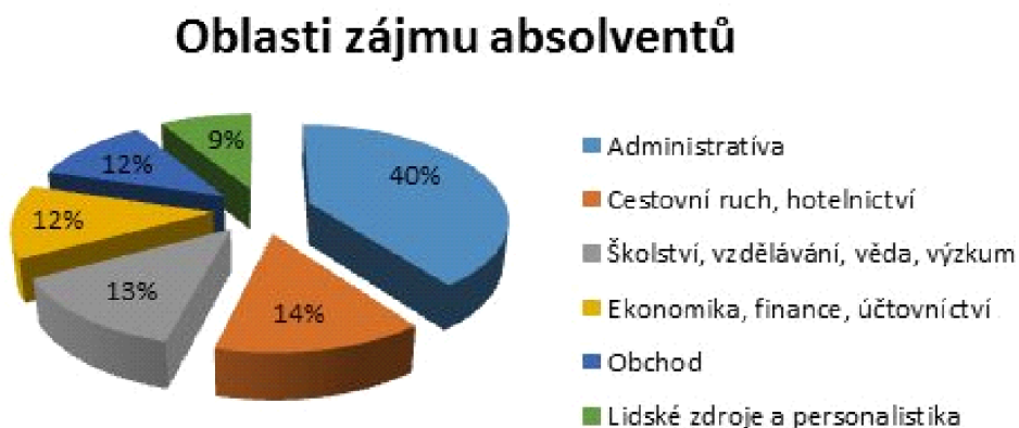
Graf č. 2: Oblasti, ve kterých absolventi hledají uplatnění nejvíce

Největší zájem mají absolventi o pozice v administrativě. Administrativní práce jsou pro ně totiž dobrým startem v jejich kariéře. Zde mohou prokázat své vlastnosti, jako jsou například organizační schopnosti, spolehlivost, zodpovědnost a práce s počítačem. Dále se absolventi zajímají o cestovní ruch, oblast školství či o ekonomiku nebo obchod.